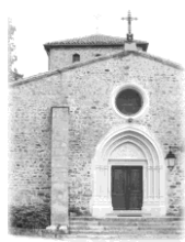
Sts Pierre et Paul